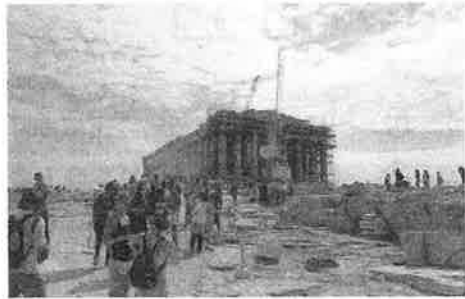
19世紀初頭アクロポリス前門からの眺め(左)と現在のアクロポリス(右)

問 4 下線部④に関連して、古代のギリシア世界について述べた文として最も適当なものを、次の①～④のうちから一つ選べ。 4