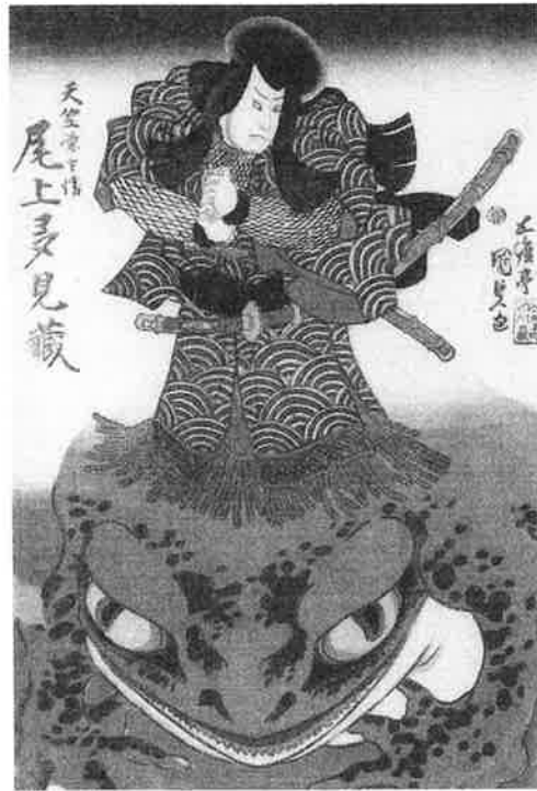
「天竺徳兵衛」を演じる役者の錦絵(歌川国貞作)

B 日本船による海外交易が盛んになった17世紀前半には、南シナ海の航路に沿って、④ 各地を巡った日本人が多数存在した 。播州高砂(現在の兵庫県高砂市)出身の船乗り徳兵衛もその一人である。1626年ごろ、豪商角倉與市の⑤ 船 に乗り長崎を出発し、シャム(現在のタイ)に渡り、2年後に帰国した。さらに1630年には、オランダ商船で再び東南アジアを訪れたとされる。当時の日本では、東南アジアは「天竺」の一部と考えられており、船乗り徳兵衛が残した渡航の記録は『天竺徳兵衛物語』として知られる。没後、彼は異国情緒を背景に妖術使い「天竺徳兵衛」として脚色され、歌舞伎などの⑥ 芸能 作品で演じられるようになった(下図参照)。